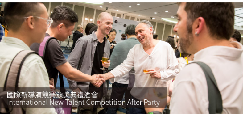
國際新導演競賽頒獎典禮酒會 International New Talent Competition After Party