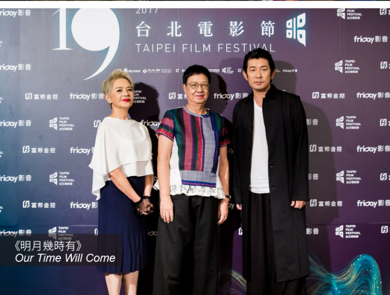
《明月幾時有》 Our Time Will Come