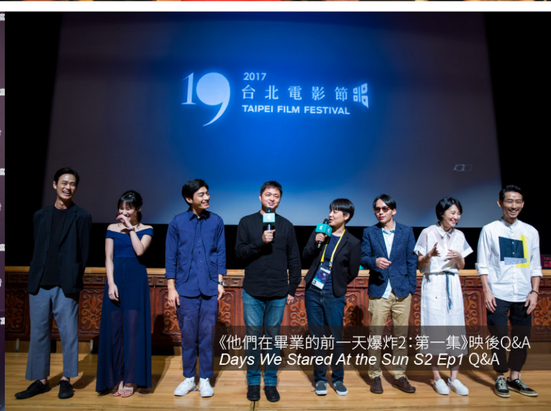
《他們在畢業的前一天爆炸2：第一集》映後Q&A Days We Stared At the Sun S2 Ep1 Q&A