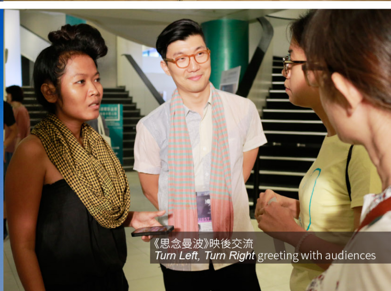
《思念曼波》映後交流 Turn Left, Turn Right greeting with audiences