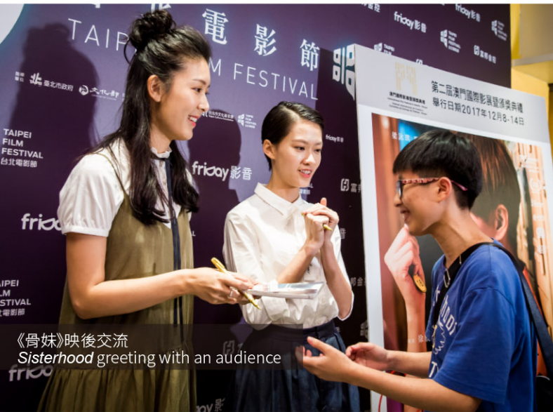
《骨妹》映後交流 Sisterhood greeting with an audience