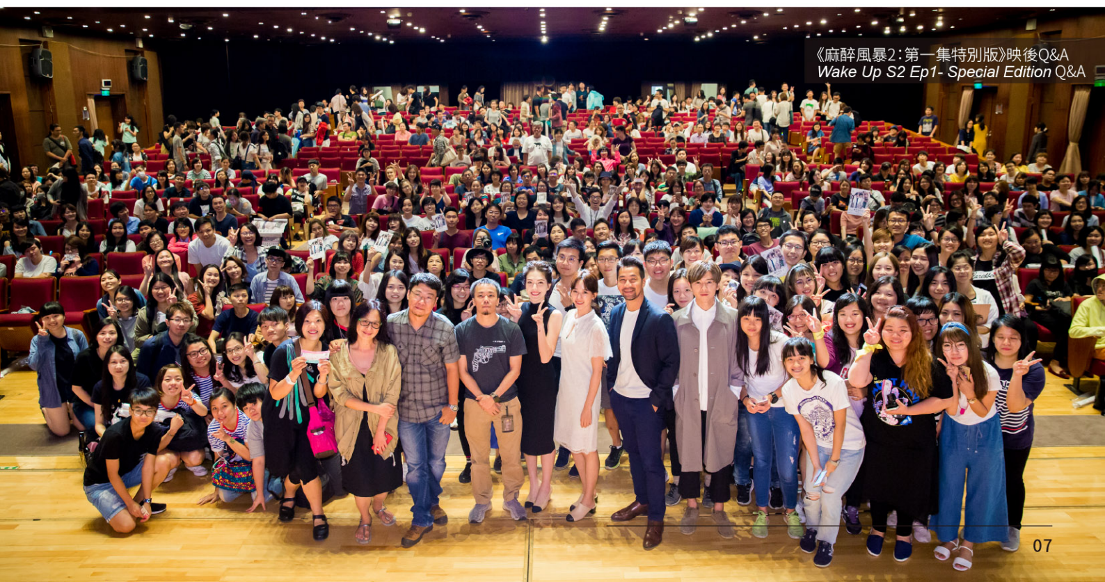
《麻醉風暴2:第一集特別版》映後Q&A Wake Up S2 Ep1- Special Edition Q&A