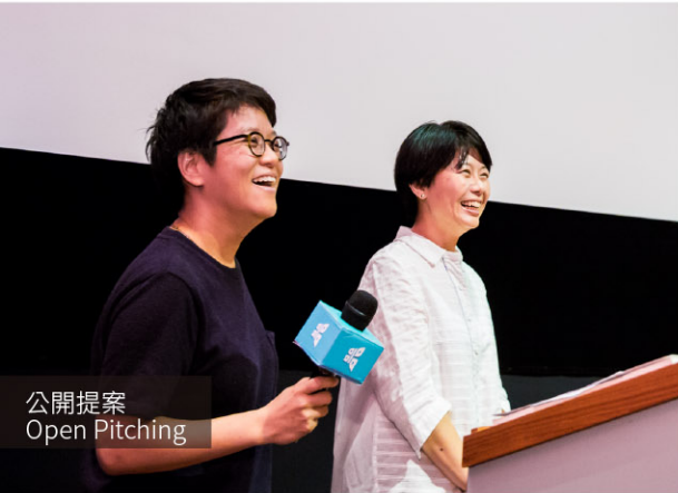
公開提案 Open Pitching