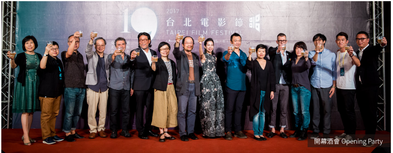
開幕酒會 Opening Party

《大佛普拉斯》The Great Buddha + 世界首映 World Premiere