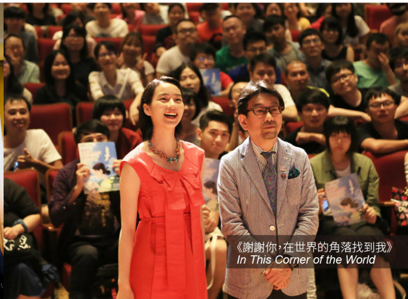
《謝謝你，在世界的角落找到我》 In This Corner of the World