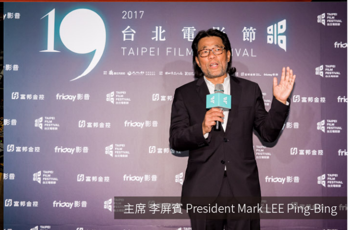
主席 李屏賓 President Mark LEE Ping-Bing