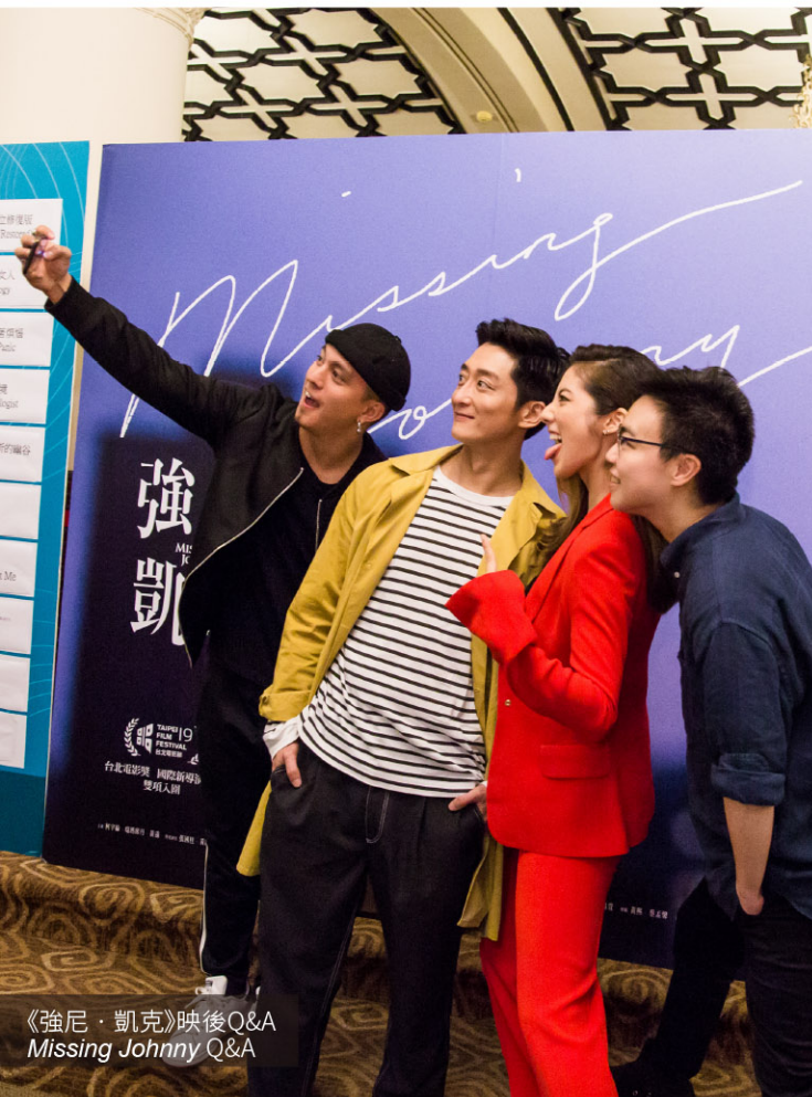
《強尼·凱克》映後Q&A Missing Johnny Q&A