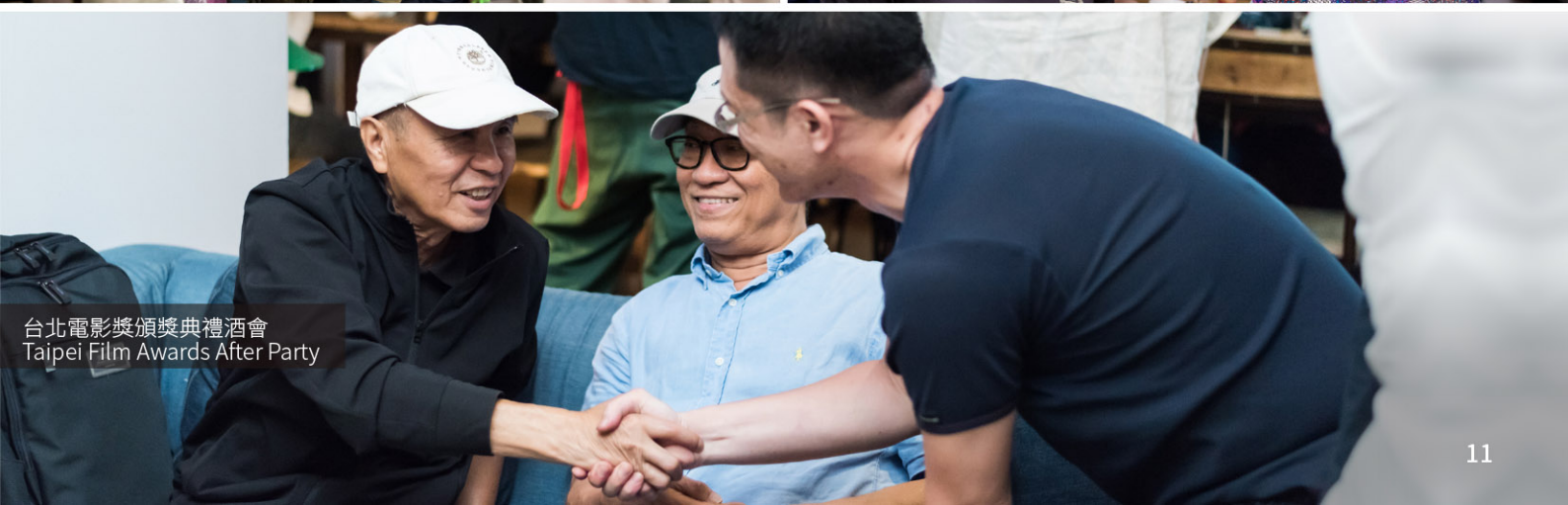
台北電影獎頒獎典禮酒會 Taipei Film Awards After Party