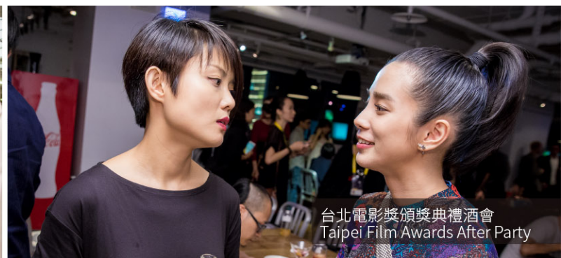
台北電影獎頒獎典禮酒會 Taipei Film Awards After Party