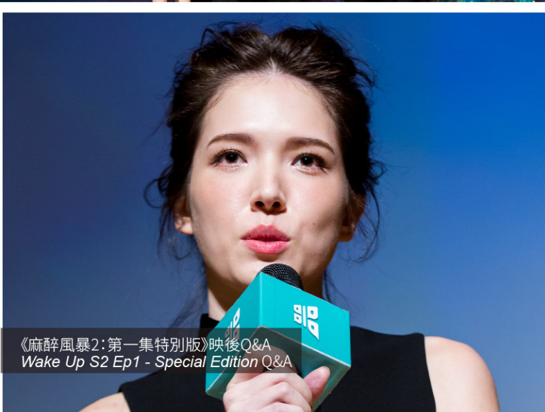
《麻醉風暴2：第一集特別版》映後Q&A Wake Up S2 Ep1 - Special Edition Q&A